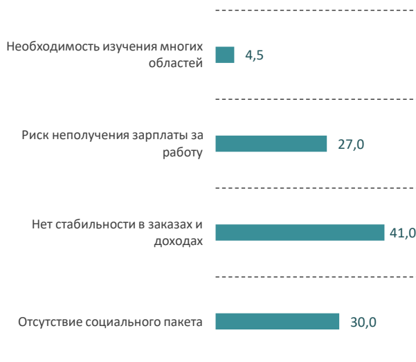
Рис. 6. Распределение ответов на вопрос «Какие отрицательные стороны Вы видите в фрилансе?», %