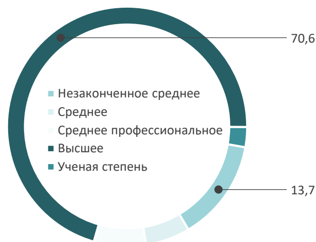
Рис. 1. Распределение ответов на вопрос «Ваше образование», %

крытого и закрытого типа. Всего был опрошен 51 человек, из которых 78,4% – лица женского пола, 21,6% – мужского. Причем 92,2% опрошенных проживает в городской местности, а 7,8% – в сельской. Большинство (70,6%) имеет высшее образование и находится в возрасте от 35 до 50 лет (рис. 1, 2).