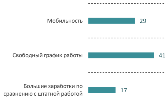
Рис. 5. Распределение ответов на вопрос «Какие положительные стороны Вы видите в фрилансе?», %

Далее мы попытались выяснить, что участники анкетирования понимают под термином «фриланс». Большинство считают, что это нестандартный вид занятости, который характеризуется свободой в организации труда работника через самоорганизацию на всех ее этапах. Из положительных сторон фриланса опрошенные отмечают свободный график работы и мобильность (рис. 5). Из отрицательных сторон чаще всего выделяют отсутствие социального пакета и нестабильность в заказах и доходах (рис. 6).