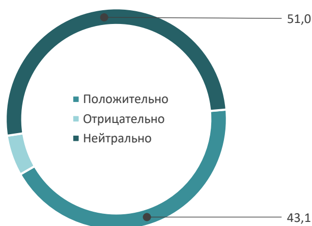
Рис. 7. Распределение ответов на вопрос «Как Вы относитесь к фрилансу?» , %

Большинство участников анкетирования не имеют четкой оценочной позиции в отношении фриланса (рис. 7). Несмотря на то, что в нашу жизнь внедряется все больше новых технологий, коммуникаций, возможностей для самостоятельной занятости, официальное трудоустройство по мнению 88,2% респондентов остается наиболее надежным видом устройства на работу (рис. 8).