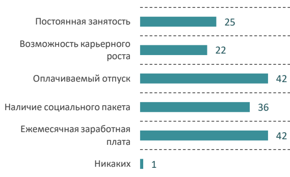
Рис. 3. Распределение ответов на вопрос «Какие положительные стороны Вы видите в официальном трудоустройстве?», %

сущность данного понятия и большинство трактует его как «установленный законом порядок оформления работников в соответствии с Трудовым кодексом Российской Федерации». Из положительных сторон официального трудоустройства респонденты выделяют наличие ежемесячной заработной платы и оплачиваемый отпуск (рис. 3). Из отрицательных – опрошенные чаще всего отмечают наличие длительного режима работы (чаще всего с 08.00 до 17.00) и то, что в некоторых случаях трудовой договор может запрещать внешнее совмещение (рис. 4).