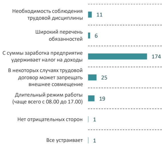
Рис. 4. Распределение ответов на вопрос «Какие отрицательные стороны Вы видите в официальном трудоустройстве?», %

Далее мы попытались выяснить, что участники анкетирования понимают под термином «фриланс». Большинство считают, что это нестандартный вид занятости, который характеризуется свободой в организации труда работника через самоорганизацию на всех ее этапах. Из положительных сторон фриланса опрошенные отмечают свободный график работы и мобильность (рис. 5). Из отрицательных сторон чаще всего выделяют отсутствие социального пакета и нестабильность в заказах и доходах (рис. 6).