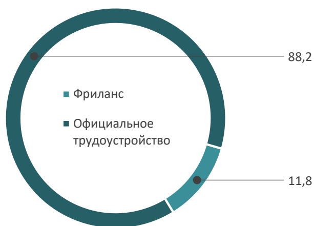
Рис. 8. Распределение ответов на вопрос «Какой вид заработка Вы считаете более надежным?» , %

Таким образом, большинство жителей Вологодской области на данный момент отдает предпочтение официальному трудоустройству. Несмотря на то, что фриланс обладает рядом сильных сторон, наличие недостатков, прежде всего возможности не получения заработной платы, нестабильных доходов, приводят к выбору людьми официального трудоустройства. Однако данная форма трудоустройства все же существует в Вологодской области, и для большинства опрошенных, занимавшихся фрилансом, результаты данной деятельности были положительными. Это говорит о том, что, несмотря на ряд неудобств, фриланс как форма занятости привлекает население рядом своих преимуществ, которые становятся все более очевидными в рамках новой парадигмы занятости (отсутствие контроля со стороны работодателя, гибкий график работы и т. п.).