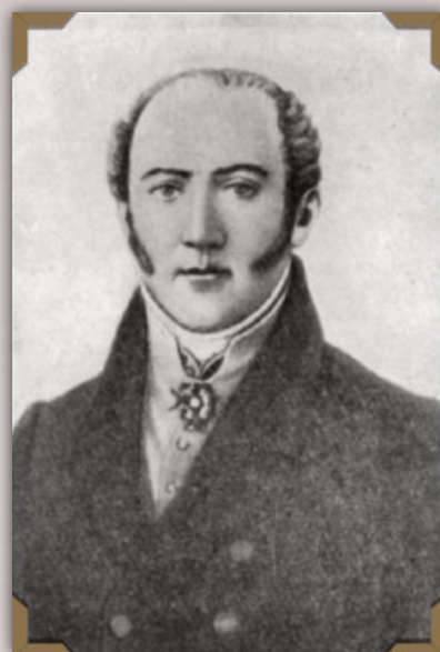
Семён Герасимович Зыбелин 1735 – 1802

5 сентября 2025 года исполнилось 290 лет со дня рождения первого студента старейшего университета России – МГУ им. М.В. Ломоносова